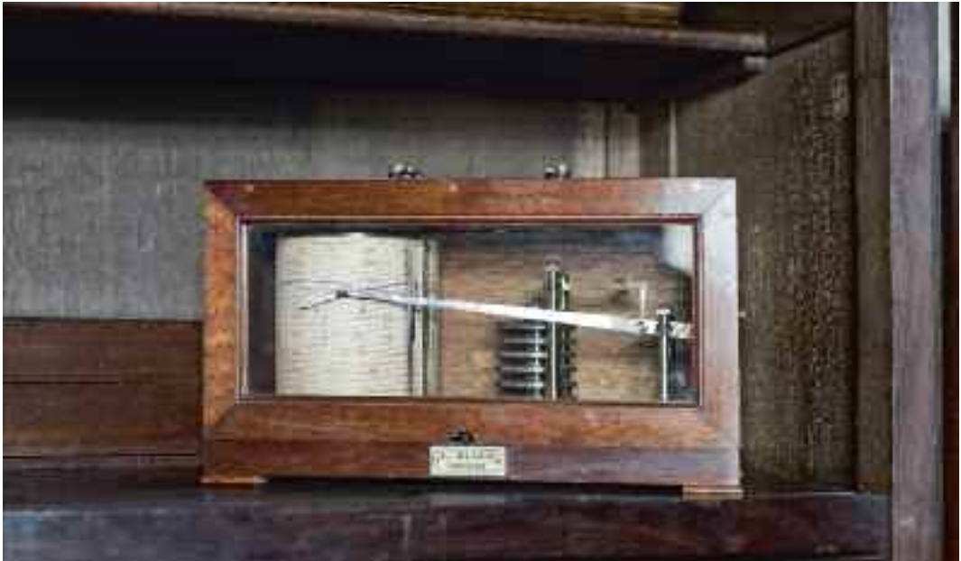
Afb. 54. Vroeger kon men inzicht in de relatieve luchtvochtigheid en temperatuur krijgen met een thermo-hygrograaf, zoals op deze afbeelding; tegenwoordig worden dataloggers gebruikt.

divers: een omschrijving van de bijzonderheden per vertrek (ruimteboek), technische gebouwinformatie, een adressenbestand van wie wat kan uitvoeren en nog veel meer. Afhankelijk van onder meer de complexiteit van de locatie bepaalt de eigenaar of beheerder zelf hoe uitgebreid de documentatie moet zijn. (zie tabel IV)