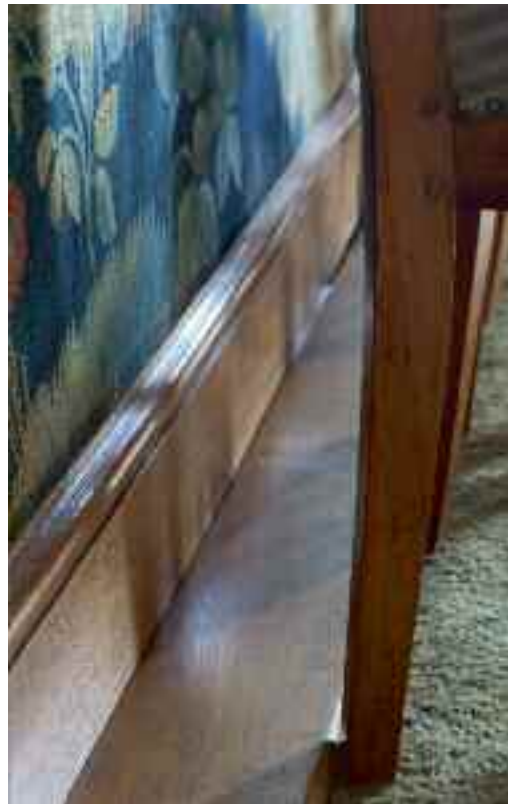
Afb. 55. Relatief kleine aanpassingen kunnen vaak veel schade voorkomen. Dit stoelenbord voorkomt dat rugleuningen schade toebrengen aan de wandbespanning.

Om te weten of het kabinet inderdaad niet door houtborende insecten wordt aangetast, is het noodzakelijk om met enige regelmaat te detecteren of zich (beginnende) schade voordoet. Dit detecteren is een combinatie van activiteiten die bekend staan als inspecteren en monitoren. Zo zal het kabi-