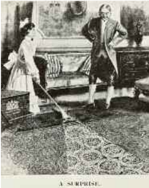
Afb. 6. De uitvinding van de stofzuiger was een sprong vooruit in de strijd tegen stof, maar de nog niet regelbare zuigkracht was minder goed voor kwetsbare materialen zoals textiel.

tieve conservering van interieurs'. Daarmee wordt het volgende bedoeld: het geheel van maatregelen en handelingen ter bescherming van de onroerende én roerende interieurelementen, gericht op het scheppen van zo goed mogelijke bewaarcondities. Preventieve conservering van interieurs heeft tot doel waardevolle interieurs of hun elementen zo lang mogelijk te behouden, risico's op schade tot een minimum te beperken, de cultuurhistorische waarden veilig te stellen en slijtageprocessen tegen te gaan of te vertragen. Dit alles om dure conserverings-, restauratie- of reconstructiewerkzaamheden te voorkomen of zo lang mogelijk uit te stellen.