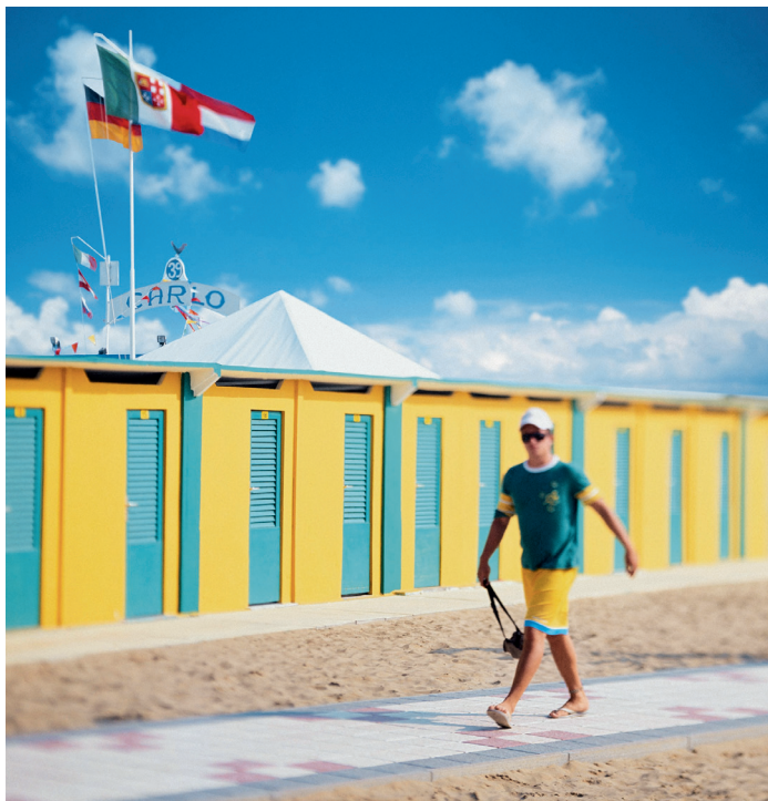
Kleedhokjes bij het strand van Rimini, waar in 1843 het eerste lido openging

sen Comacchio en Cattolica ook zonder de spreekwoordelijke bril roze, want straatlantaarns, hotels, restaurants en historische monumenten verspreiden dan in een ode aan de levensvreugde, liefde en hartstocht roze licht, terwijl ligstoelen, gerechten, drankjes en zelfs haar in diezelfde kleur zijn gehouden. Aan zee, bij de strandpromenaden en op de pleinen van de historische centra vinden gratis concerten, theaterstukken en tentoonstellingen plaats, die sinds de eerste Notte Rosa van 2006 worden georganiseerd door de Adriatische provincies, gemeenten en particuliere sponsors. Als het culturele programma om middernacht eindigt, gaat het feesten tot in de vroege uurtjes door in bars en