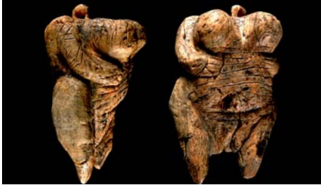
De Venus van Hohle Fels

Het grote belang van deze vondst is dat ermee is aangetoond dat zoveel millennia geleden mensen al vormgaven aan beelden en de behoefte hadden hun werkelijkheid te 'verbeelden'. Zo getuigen ook grottekeningen van de menselijke fascinatie voor de visuele omgeving en het gebruik van het visuele waarnemingsvermogen. In hun beelden legden ze een verband tussen hun visuele ervaringen en hun innerlijke beleving. Met materie gaven ze betekenis aan hun beelden.